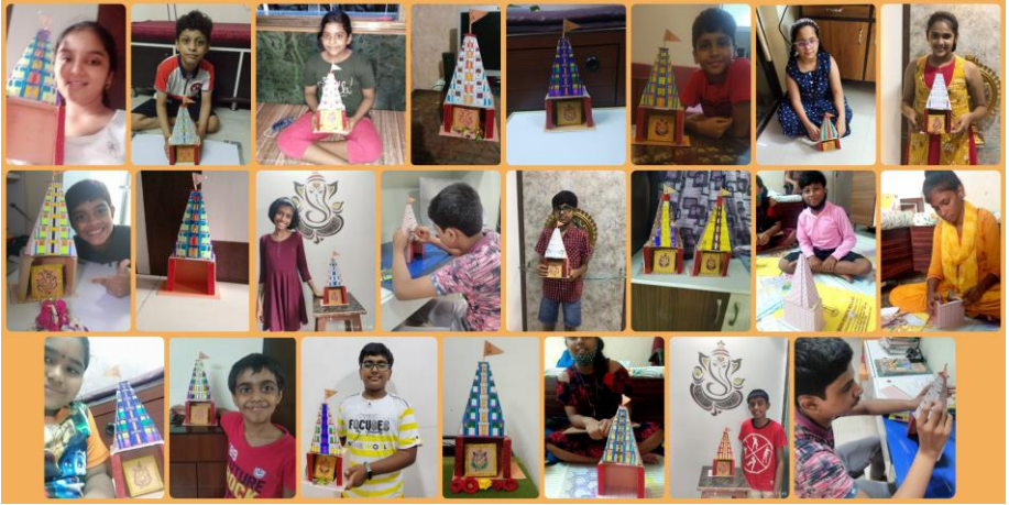
Children exhibiting their art work during the online camp