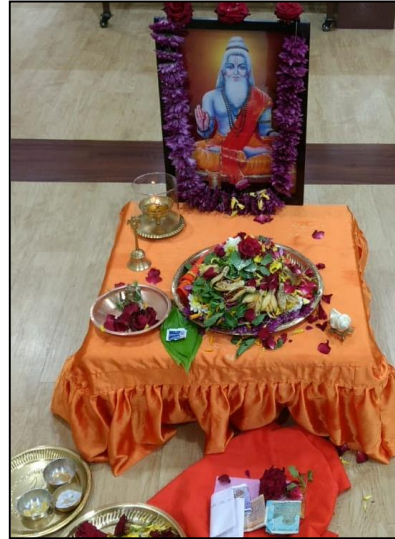
Guru Purnima Celebrations at Chinmaya Shreeram